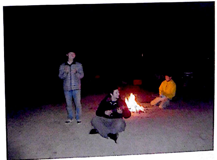
ボーイスカウトのキャンプにて②